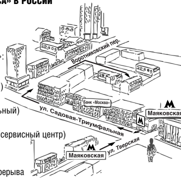
Схема расположения Центра технического обслуживания «СиЭс Медика»

«СиЭс Медика» в г. Москва: пн-пт: с 09.30 до 19.00 (без перерыва на обед), сб: с 10.00 до 18.00 (без перерыва на обед), вс и праздничные дни - выходной