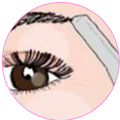
Триммер прекрасно подходит для коррекции бровей