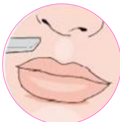
Удаляет волоски над губой для создания гладкой кожи