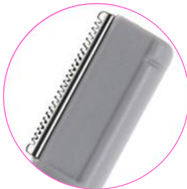
Насадка - лезвие