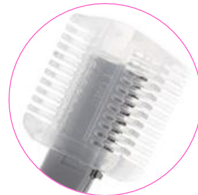
Насадка-расческа с двумя установками длины