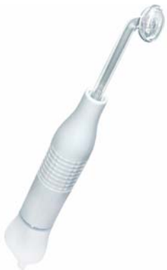
ДАРСОНВАЛЬ BIOLIFT4 103

Универсальный массажер с 4-мя насадками устраняет множество косметических недостатков лица и тела. Плавная регулировка мощности делает процедуры комфортными.