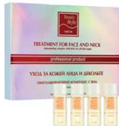
СЫВОРОТКА ДЛЯ ЛИЦА РЕГУЛИРУЮЩАЯ BEAUTY STYLE

Средство нормализует салоотделение, уменьшает диаметр пор, снимает воспаление. Применяется как самостоятельное средство или в сочетании с УЗ-массажем и микротоками.