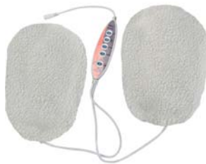
ТЕРМОВАРЕЖКИ ДЛЯ РУК С ИК-ПРОГРЕВОМ HAND SPA AMG115

Высокоскоростной набор для проведения процедур маникюра и педикюра. Семь сменных насадок с долговечным абразивным напылением.