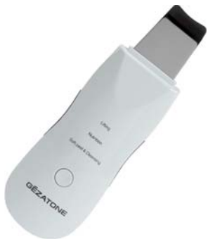
АППАРАТ ДЛЯ УЗ-ПИЛИНГА BIO SONIC 800

Портативный аппарат для УЗ обеспечит глубокое и бережное очищение, коррекцию акне и постакне, выровняет тон и наполнит кожу сиянием.