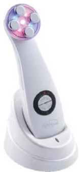
МАССАЖЕР «МЕЗОТЕРАПИЯ БЕЗ ИГЛЫ» M9910

Аппарат с использованием 5-ти уникальных косметологических технологий для омоложения и безоперационной подтяжки на лице и в области декольте.