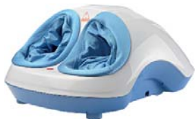
МАССАЖЕР ДЛЯ НОГ SKY STEP AMG718

Снимает усталость ног, устраняет отеки, улучшает общее самочувствие. Массаж ног с функцией роликового массажа, прессотерапии и прогревания.