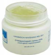
ПИЛИНГ-ГЕЛЬ «ХОЛОДНОЕ ГИДРИРОВАНИЕ» BEAUTY STYLE АКВА 24

Гель для глубокого очищения кожи. Не вызывает раздражения и покраснения. Великолепно очищает, увлажняет кожу и выравнивает цвет лица.