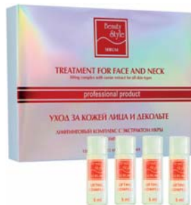
ЛИФТИНГОВАЯ СЫВОРОТКА ДЛЯ ЛИЦА С ЭКСТРАКТОМ ИКРЫ BEAUTY STYLE

Сыворотка запускает процесс естественного омоложения, обеспечивает эффект подтяжки кожи. Может применяться в процедурах аппаратного ухода или самостоятельно.