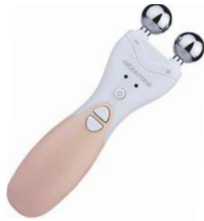
МАССАЖЕР ДЛЯ ЛИЦА МИОСТИМУЛЯЦИЯ + ГАЛЬВАНИКА BIOLIFT4 M701

Многоуровневый лифтинг и омоложение кожи, сочетающий воздействие ультразвуком и укрепление мышц при помощи электростимуляции.