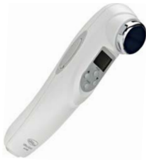
МАССАЖЕР ДЛЯ ЛИЦА, ШЕИ И ТЕЛА УЛЬТРАЗВУК + МИОСТИМУЛЯЦИЯ M115

Аппарат, сочетающий методики пластического массажа и электростимуляции, поднимают опустившиеся мышцы, возвращает четкость контурам лица.