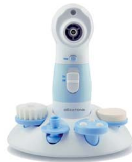
ВАКУУМНЫЙ ОЧИСТИТЕЛЬ КОЖИ SUPER WET CLEANER PRO

Классическая паровая сауна для лица оснащена удобной чашей и насадкой для ингаляции, имеет регулировку мощности подачи пара.