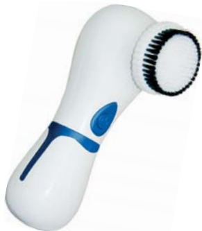
МАССАЖЕР-ЩЕТКА BIO SONIC AMG197

Аппарат поможет избавиться от черных точек и улучшить внешний вид кожи. Щетка для лица подходит как для ежедневного умывания, так и для очищения пор от загрязнений.