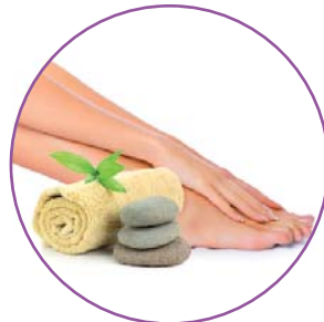
УХОД ЗА РУКАМИ И НОГАМИ

Уникальные технологии, позволяющие в домашних условиях провести высококачественные процедуры по избавлению от целлюлита и растяжек, улучшению тонуса кожи.