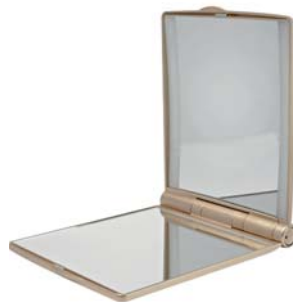
ЗЕРКАЛО-ПЛАНШЕТ 1/3X С ПОДСВЕТКОЙ LM1417

Стильное, удобное и компактное зеркало-планшет для нанесения макияжа и проведения косметических процедур – Ваш образ безупречен!