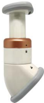
ТРЕНАЖЕР ДЛЯ ШЕИ NECK LIFTING AMG 617

Забудьте о «втором подбородке» и нечетких контурах лица – миостимулятор m703 скорректирует контуры шеи и подбородка и вернет Вам привлекательный внешний вид.