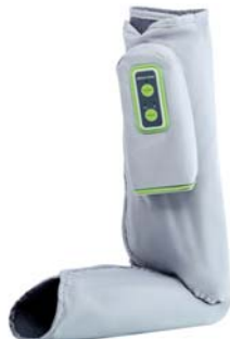
МАССАЖЕР ДЛЯ НОГ LIGHT FEET AMG709

Массажер сочетает в себе техники восстанавливающего массажа Шиаци с интенсивным роликовым массажем. Быстро снимает усталость, улучшает самочувствие.