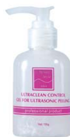
ОЧИЩАЮЩИЙ ГЕЛЬ «УЛЬТРАКЛИН КОНТРОЛЬ» BEAUTY STYLE

Средство нормализует салоотделение, уменьшает диаметр пор, снимает воспаление. Применяется как самостоятельное средство или в сочетании с УЗ-массажем и микротоками.