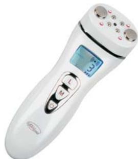
АППАРАТ ДЛЯ RF-ЛИФТИНГА RF-ЛИФТИНГ M1601

Трехмерное омоложение кожи и стимуляция выработки собственного коллагена и эластина в домашних условиях с помощью высокочастотных радиоволн.