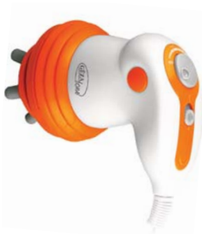
МАССАЖЕР ДЛЯ ПОХУДЕНИЯ BODYSHAPER AMG121

Антицеллюлитный массажер для тела с 4 насадками и ИК-прогревом способствует уменьшению лишних жировых отложений, а также улучшению тургора кожи.