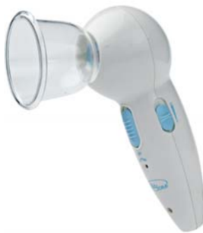
АНТИЦЕЛЛЮЛИТНЫЙ МАССАЖЕР VACU BEAUTY

Уникальный вакуумный массажер Vacu Expert 2 в 1 не только справится с «апельсиновой коркой» и жировыми отложениями, но и повысит тонус и упругость кожи.