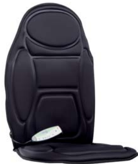
МАССАЖНЫЙ КОВРИК С ПРОГРЕВОМ AMG 388

Интенсивный глубокий массаж шеи и спины, функция прогревания в компактном корпусе массажной накидки «3D Pad», которую можно применять дома и в офисе.