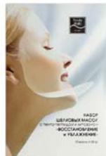
ШЕЛКОВЫЕ МАСКИ С ХИТОЗАНОМ BEAUTY STYLE

Гель для глубокого очищения кожи. Не вызывает раздражения и покраснения. Великолепно очищает, увлажняет кожу и выравнивает цвет лица.