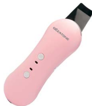
АППАРАТ ДЛЯ УЗ-ПИЛИНГА HS2307i(S)

Глубоко очищает кожу от загрязнений и черных точек, дает ей необходимое питание и увлажнение, позволяет провести высокоэффективные лифтинг-процедуры у себя дома.