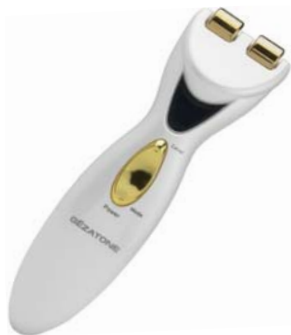
МИОСТИМУЛЯТОР ДЛЯ ШЕИ BIOLIFT4 M703

Забудьте о «втором подбородке» и нечетких контурах лица – миостимулятор m703 скорректирует контуры шеи и подбородка и вернет Вам привлекательный внешний вид.