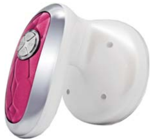
АНТИЦЕЛЛЮЛИТНЫЙ МАССАЖЕР BIOSONIC 1130

Антицеллюлитный массажер использует три эффективных методики для коррекции фигуры: ультразвук, RF-лифтинг и хромотерапию.