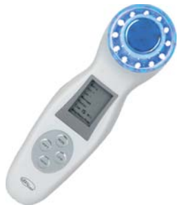
УЛЬТРАЗВУКОВОЙ МАССАЖЕР ДЛЯ ЛИЦА SUPERLIFTING M356

Проводить ультразвуковой массаж следует активными курсами в 6-8 недель, используя прибор 3 раза в неделю. Перед использованием прибора кожу необходимо очистить от загрязнений и макияжа. Затем рекомендуется нанести активную сыворотку. Ее насыщенная формула позволит быстро решить поставленные косметические задачи. Поверх сыворотки на обрабатываемый участок наносится проводящий гель, который обеспечивает равномерное распределение УЗ волн. По окончании процедуры гель рекомендуется смыть, а на лицо нанести крем по типу кожи.