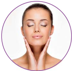
МАССАЖЕРЫ ДЛЯ ЛИЦА

Аппараты для интенсивного ухода за кожей: чистка лица, подтяжка, удаление морщин, улучшение цвета и внешнего вида, коррекция проблемной кожи.