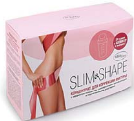
КОНЦЕНТРАТ-ПРОПИТКА ДЛЯ ПОХУДЕНИЯ SLIM&SHAPE

Элегантный комбидрес поможет избавиться от избыточных жировых отложений и выровнять рельеф кожи, уменьшит объемы бедер и придаст фигуре изящество.