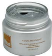
ГЕЛЬ ДЛЯ ГЛУБОКОГО ОЧИЩЕНИЯ КОЖИ «КОМФОРТ» BEAUTY STYLE

Гель для глубокого очищения кожи. Не вызывает раздражения и покраснения. Великолепно очищает, увлажняет кожу и выравнивает цвет лица.