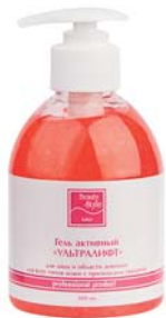
ГЕЛЬ «УЛЬТРАЛИФТ» BEAUTY STYLE

Активный гель для проведения аппаратных процедур (УЗ-массажа, микротоковой терапии, миостимуляции). Омолаживает и увлажняет кожу. Для всех типов увядающей кожи.