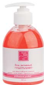
ГЕЛЬ «УЛЬТРАЛИФТ» BEAUTY STYLE

Активный гель для проведения аппаратных процедур (УЗ-массажа, микро-токовой терапии, миостимуляции). Омолаживает и увлажняет кожу. Для всех типов увядающей кожи.