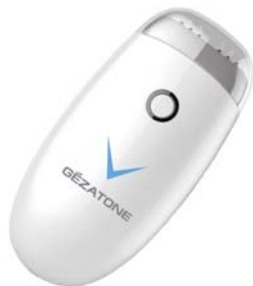
АППАРАТ ДЛЯ RF-ЛИФТИНГА V-LINE M1603

Трехмерное омоложение кожи и стимуляция выработки собственного коллагена и эластина в домашних условиях с помощью высокочастотных радиоволн.