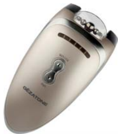
РОЛИКОВЫЙ МАССАЖЕР- МИОСТИМУЛЯТОР BIOLIFT4 M270

Это обеспечивает двойной эффект: мышцы подтягиваются, а кожа становится более упругой.