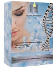
МАСКИ ДЛЯ ЛИЦА С БИОЦЕЛЛЮЛОЗОЙ- BEAUTY STYLE

Гель для глубокого очищения кожи. Не вызывает раздражения и покраснения. Великолепно очищает, увлажняет кожу и выравнивает цвет лица.