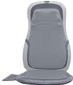
МАССАЖНАЯ НАКИДКА CYBER RELAX AMG399

Универсальная накидка-массажер для использования дома, в офисе или в автомобиле позволяет провести профессиональный массаж спины и поясницы, шеи и бедер.