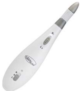
НАБОР ДЛЯ МАНИКЮРА И ПЕДИКЮРА PROFESSIONAL NAIL CARE 136D

Аппарат для проведения маникюра и педикюра оснащен семью сменными насадками с сапфировым напылением. Имеет сенсорное управление и подсветку.