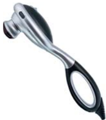
ВИБРОМАССАЖЕР С ИК-ПРОГРЕВОМ AMG105

Универсальный роликовый массажер предназначен для глубокого разминающего массажа шеи и плеч, поясничной области и живота, кистей и ног.