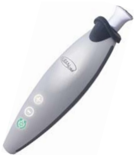
НАБОР ДЛЯ МАНИКЮРА И ПЕДИКЮРА PROFESSIONAL NAIL CARE 130D

Аппарат для проведения маникюра и педикюра оснащен семью сменными насадками с сапфировым напылением. Имеет сенсорное управление и подсветку.