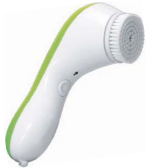
ЩЕТКА ДЛЯ ОЧИЩЕНИЯ SONICLENSE AMG195

Аппарат поможет избавиться от черных точек и улучшить внешний вид кожи. Щетка для лица подходит как для ежедневного умывания, так и для очищения пор от загрязнений.