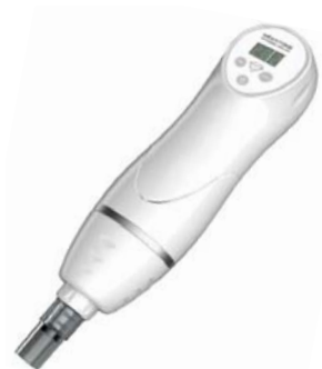
АППАРАТ ДЛЯ ДЕРМАБРАЗИИ DIAMOND PEELING MD-3A 917

С прибором для алмазного пилинга Вы сможете прямо в домашних условиях получить профессиональный эффект очищения, микрошлифовки и отбеливания кожи!