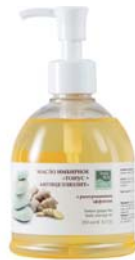
МАСЛО ИМБИРНОЕ «ТОНУС + АНТИЦЕЛЛЮЛИТ» BEAUTY STYLE

Натуральное масло для проведения массажных процедур. Нормализует тонус сосудов и стимулирует выведение токсинов, уменьшает целлюлит.