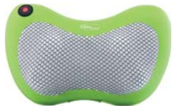
МАССАЖНАЯ ПОДУШКА ДОБРЫЙ ПОПУТЧИК AMG392

Массаж шеи, плеч, спины и поясницы четырьмя роликами с одновременным инфракрасным излучением. Эргономичный дизайн для использования как дома, так и в автомобиле.