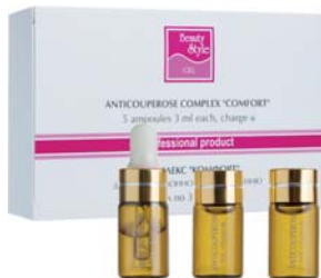
КОМПЛЕКС ПРОТИВОКУПЕРОЗНЫЙ BEAUTY STYLE

Активный гель для проведения аппаратных процедур (УЗ-массажа, микро-токовой терапии, миостимуляции). Омолаживает и увлажняет кожу. Для всех типов увядающей кожи.