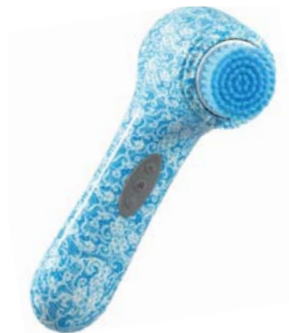
ЩЕТКА ДЛЯ ОЧИЩЕНИЯ TENDER BEAUTY AMG106SA

Три щеточки с разной щетиной идеально очищают и тонизируют кожу, удаляя комедоны и остатки макияжа. Вы увидите результат уже через 60 секунд применения!