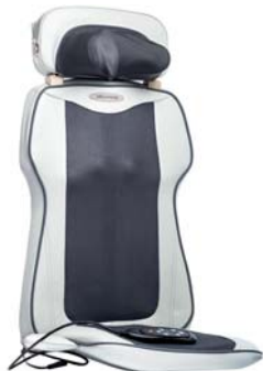
МАССАЖНАЯ НАКИДКА 3D PAD AMG387

Массаж шеи, плеч, спины и поясницы четырьмя роликами с одновременным инфракрасным излучением. Эргономичный дизайн для использования как дома, так и в автомобиле.