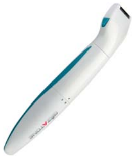
МАШИНКА ДЛЯ СТРИЖКИ И БИКИНИ-ДИЗАЙНА 3 В 1 DP515

Настоящий помощник для прекрасных дам. Три насадки: для стрижки, бритья и очищения кожи – то, что нужно дома и в путешествии!