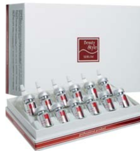
СЫВОРОТКА ДЛЯ ЛИЦА С ГИАЛУРОНОВОЙ КИСЛОТОЙ BEAUTY STYLE

Сыворотка запускает процесс естественного омоложения, обеспечивает эффект подтяжки кожи. Может применяться в процедурах аппаратного ухода или самостоятельно.