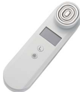
АППАРАТ RF-ЛИФТИНГ + МИКРОТОКИ M1605

Безоперационная подтяжка лица дома! Курс процедур поможет Вам стать на несколько лет моложе. Функция миостимуляции восстановит тонус мышц лица и тела.