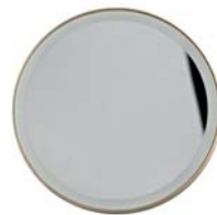
ЗЕРКАЛО 10X С ПОДСВЕТКОЙ LM100

Стильное, удобное и компактное зеркало-планшет для нанесения макияжа и проведения косметических процедур – Ваш образ безупречен!