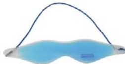
МАССАЖЕР ДЛЯ ГЛАЗ ISEE 380

Лимфодренажный массажер для глаз с функцией вибрации снимает усталость и восстанавливает функции зрения, устраняет отеки и синяки.