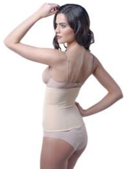
КОРСЕТ WAISTBAND SLIM&SHAPE

Корректирующий корсет из дышащего материала, созданного по инновационной технологии. Превосходно моделирует фигуру, создавая изящный стройный силуэт.