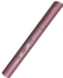
ТРИММЕР ДЛЯ БРОВЕЙ И ЗОНЫ БИКИНИ DP508

Компактная и безопасная бритва избавит Вас от лишних волос на ногах, в области подмышек и бикини. И все это без особого труда!