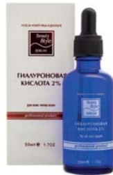
СЫВОРОТКА ДЛЯ ЛИЦА «ГИАЛУРОНОВАЯ КИСЛОТА 2%» BEAUTY STYLE

Гель для всех типов кожи, особенно для сухой, дегидратированной кожи. Обеспечивает моментальное увлажнение, делает кожу гладкой и мягкой.