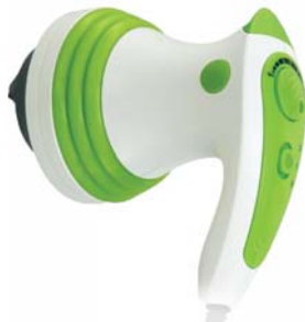
МАССАЖЕР ДЛЯ ПОХУДЕНИЯ BODYSHAPER AMG125

Антицеллюлитный массажер для тела с 4 насадками и ИК-прогревом способствует уменьшению лишних жировых отложений, а также улучшению тургора кожи.