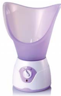
ПАРОВАЯ САУНА С ИНГАЛЯТОРОМ 105S

Классическая паровая сауна для лица оснащена удобной чашей и насадкой для ингаляции, имеет регулировку мощности подачи пара.