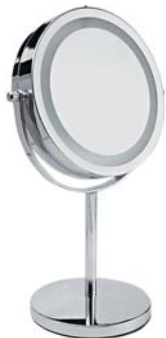
ЗЕРКАЛО С ПОДСВЕТКОЙ LM194

Удобное настольное зеркало имеет круговую подсветку и 5-кратное увеличение одной из сторон. Идеально для проведения косметических процедур.