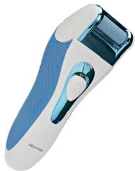
РОЛИКОВАЯ ПИЛКА PEDI PRO 126D

Электрическая пилка для моментального удаления огрубевшей кожи стоп, натоптышей и мозолей. Никогда еще процесс педикюра не был таким простым и приятным!