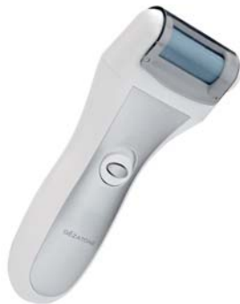
РОЛИКОВАЯ ПИЛКА PEDI LUX 124D

Электрическая пилка для моментального удаления огрубевшей кожи стоп, натоптышей и мозолей. Никогда еще процесс педикюра не был таким простым и приятным!