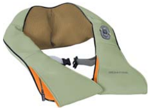
МАССАЖЕР РОЛИКОВЫЙ IRELAX AMG395

Универсальный роликовый массажер предназначен для глубокого разминающего массажа шеи и плеч, поясничной области и живота, кистей и ног.