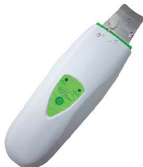
АППАРАТ ДЛЯ УЗ-ПИЛИНГА HS2307i

Попробуйте сами и увидите, что это лучшая забота о коже.