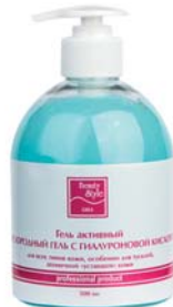
«КИСЛОРОДНЫЙ ГЕЛЬ С ГИАЛУРОНОВОЙ КИСЛОТОЙ» BEAUTY STYLE

Гель для всех типов кожи, особенно для сухой, дегидратированной кожи. Обеспечивает моментальное увлажнение, делает кожу гладкой и мягкой.