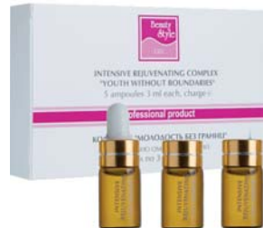
КОМПЛЕКС ОМОЛАЖИВАЮЩИЙ BEAUTY STYLE

Концентрат для проведения процедур с приборами на базе гальванических токов. Активная формула укрепляет стенки сосудов и улучшает местную микроциркуляцию.