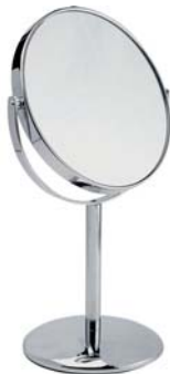
ЗЕРКАЛО 5X LM874

Удобное настольное зеркало имеет круговую подсветку и 5-кратное увеличение одной из сторон. Идеально для проведения косметических процедур.