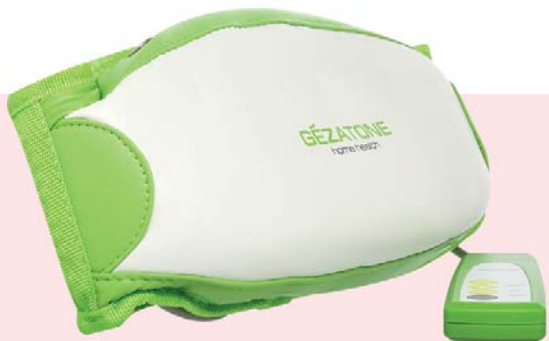
МАССАЖНЫЙ ПОЯС ДЛЯ ПОХУДЕНИЯ HOME HEALTH M141

Использовать массажные пояса можно для уменьшения жировых отложений, повышения тонуса мышц, вывода застоявшейся жидкости. Они применяются и для восстановления после тренировок. Одним словом – настоящий кладезь полезных свойств для тех, кто всерьез решил добиться идеальной фигуры!