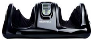
МАССАЖЕР ДЛЯ НОГ MASSAGE MAGIC AMG711

Снимает усталость ног, устраняет отеки, улучшает общее самочувствие. Массаж ног с функцией роликового массажа, прессотерапии и прогревания.