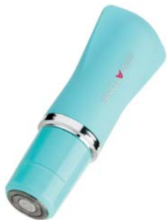
УНИВЕРСАЛЬНАЯ БРИТВА ДЛЯ ЖЕНЩИН DP512

Настоящий помощник для прекрасных дам. Три насадки: для стрижки, бритья и очищения кожи – то, что нужно дома и в путешествии!