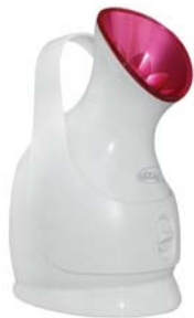
ПАРОВАЯ САУНА С НАНОИОНАМИ AQUA CARE 1051

Сауны желательно использовать регулярно, уделяя распариванию 5-10 минут 2-3 раза в неделю. Такое применение сохранит чистоту и уровень увлажненности кожи, повысит ее упругость.