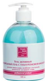
«КИСЛОРОДНЫЙ ГЕЛЬ С ГИАЛУРОНОВОЙ КИСЛОТОЙ» BEAUTY STYLE

Активный гель для проведения аппаратных процедур (УЗ-массажа, микротоковой терапии, миостимуляции). Омолаживает и увлажняет кожу. Для всех типов увядающей кожи.