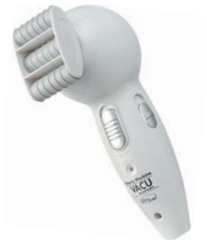
АНТИЦЕЛЛЮЛИТНЫЙ МАССАЖЕР VACU EXPERT

Уникальный вакуумный массажер Vacu Expert 2 в 1 не только справится с «апельсиновой коркой» и жировыми отложениями, но и повысит тонус и упругость кожи.