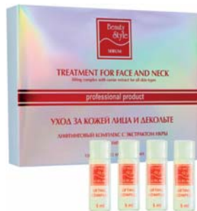
ЛИФТИНГОВАЯ СЫВОРТКА ДЛЯ ЛИЦА С ЭКСТРАКТОМ ИКРЫ BEAUTY STYLE

Сыворотка запускает процесс естественного омоложения, обеспечивает эффект подтяжки кожи. Может применяться в процедурах аппаратного ухода или самостоятельно.