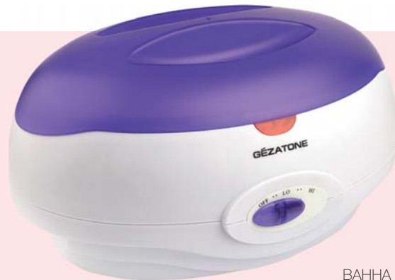
ВАННА ДЛЯ ПАРАФИНОТЕРАПИИ WW3550

Парафинотерапия – одна из самых приятных и полезных процедур ухода за руками и ногами: с ее помощью можно не только смягчить и увлажнить кожу, но и избавиться от болей в суставах, устранить усталость и стресс. Всего за один сеанс исчезает шелушение и сухость, заживляются трещинки и улучшается тонус кожи, которая становится мягкой и гладкой! Подобную процедуру обычно проводят в косметических салонах, однако теперь Вы сможете наслаждаться ей у себя дома. Для проведения процедуры потребуется ванна-нагреватель и специальный косметический парафин. В его состав входят витамины, вытяжки лекарственных растений и эфирные масла, которые не только усиливают смягчающее и увлажняющее действие парафина, но и оказывают великолепный расслабляющий эффект, снимают стресс и усталость.