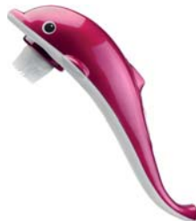
ВИБРОМАССАЖЕР С ИК-ПРОГРЕВОМ ДЕЛЬФИН AMG6093

Массаж, усиленный функцией ИК-прогрева, поможет избавиться от мышечной усталости, повысить тонус мышц, уменьшить жировые отложения и целлюлит в проблемных зонах.