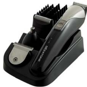
МАШИНКА ДЛЯ СТРИЖКИ И ПОДРАВНИВАНИЯ БОРОДЫ BP 207

Миниатюрная машинка для безупречного удаления волос на лице и теле, коррекции линии бикини и бровей. Везде с Вами, чтобы обеспечить необходимый уход.